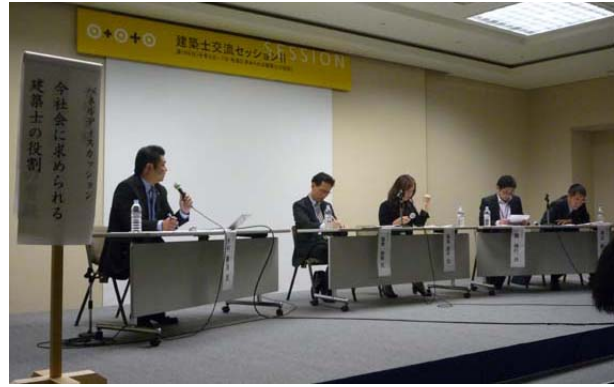
パネルディスカッション風景

セッションⅡ終了後、若手建築士交流プロジェクト会場へ移動。船に乗ってクルージング後、街並み活性のためのワークショップが開催されました（左下写真）。後から、合流した東京の青年建築士達と共に、飛び入り参加しました。川沿いをライン状に伸びる水際広場の一角で開催されていたのですが、通りかかる一般市民の方から「何をされているのですか？」と何度も声をかけられました（その度に、建築士会という職能団体の大会であること、全国から健全な建築士が集まってきていることなどを力説）。微力ながら建築士会という組織PRに貢献できたと思います。