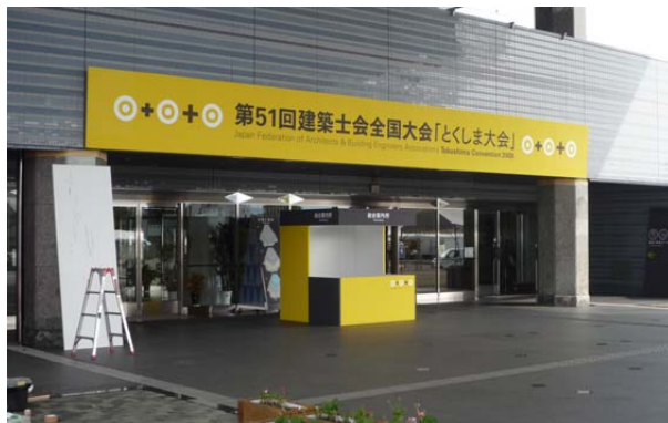
エントランス風景

エントランスから施設内に入ると、徳島県建築士会の皆さんが慌しく設営準備を進めていました。徹夜続きなのでしょうか、疲れ果ててベンチで横になっている建築士の方も見られました。次に全体開会式会場となる2階フレアホールを見学。ここも、ちょうど設営準備中でした。