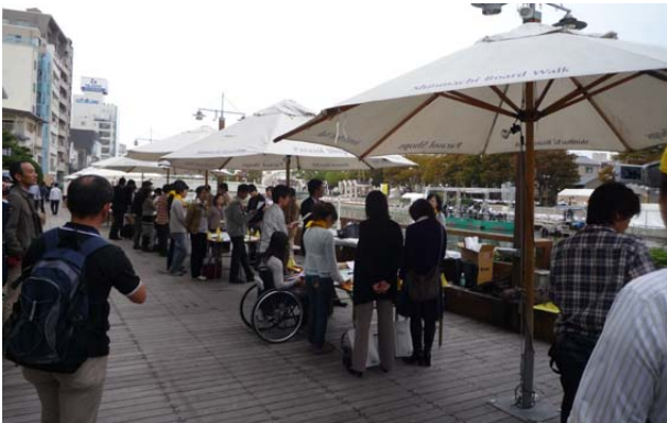
ワークショップ風景

セッションⅡ終了後、若手建築士交流プロジェクト会場へ移動。船に乗ってクルージング後、街並み活性のためのワークショップが開催されました（左下写真）。後から、合流した東京の青年建築士達と共に、飛び入り参加しました。川沿いをライン状に伸びる水際広場の一角で開催されていたのですが、通りかかる一般市民の方から「何をされているのですか？」と何度も声をかけられました（その度に、建築士会という職能団体の大会であること、全国から健全な建築士が集まってきていることなどを力説）。微力ながら建築士会という組織PRに貢献できたと思います。