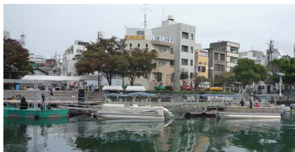
左に見えるのが新町橋