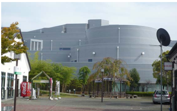
アスティーとくしま会場

街並み視察後、大会会場となるアスティーとくしまへ移動。徳島駅からタクシーで10分ほどの所にありました（左下写真）。