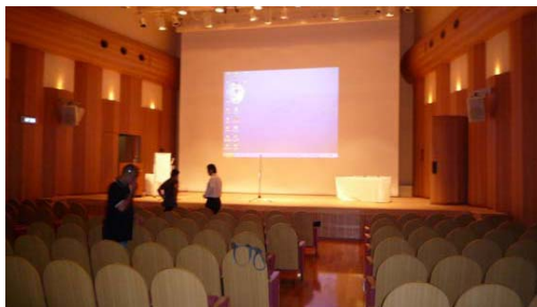
開会式会場となる2階フレアホール