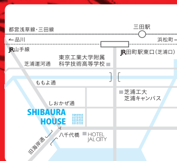
東京都港区芝浦3-15-4 SHIBAURA HOUSE